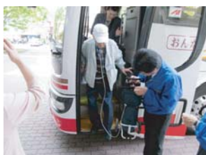
在宅酸素プロバイダーの大同商会さんも毎回協力していただいています

御船山楽園で自然に癒され、武雄センチュリーホテルの昼御膳と柔らかな温泉を堪能してきた皆さん☆ 帰りのお土産コーナーでは珍しい特産物に目を輝かせ、とても充実した旅行になったのではないのでしょうか♪今回は久しぶりの患者さん・初めての患者さん・他病院の医療スタッフにも参加していただき、いつも以上に賑やかで私たち同行スタッフも嬉しい限りでした！次回の旅はどこへ向かうのか・・・乞うご期待☆