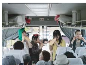
同行したスタッフもバス内でのゲームで盛り上がりまして！