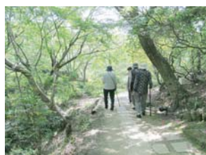
緑香る木漏れ日の中を歩いて森林浴を堪能しました♪