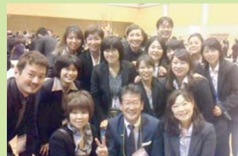
共に学んだ他病院のスタッフと