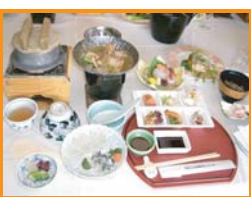
豪勢な昼御膳 窓から流れてくる心地良い潮風を感じながらいただきました♪