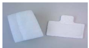
花粉用フィルター

今年は去年の猛暑の影響で、全国的に花粉の飛散量が増えるようです。 花粉症の症状があると CPAP も使えない日が増えて来ますね...。CPAP のフィルターを花粉防止用のフィルターに交換することで、楽になることもありますので、スタッフ又は各業者さんにお問い合わせください。当院でもお薬 (症状を和らげる点鼻薬、内服薬) の処方がありますので、症状のツライ方はご相談ください。