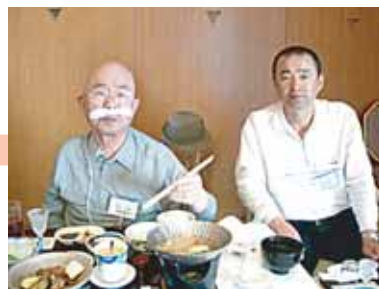
大谷山荘での宴会風景 みなさん、楽しそうですね!