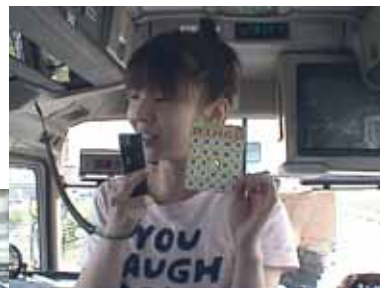
そしてビンゴ大会も