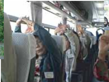
バスの中でも呼吸体操