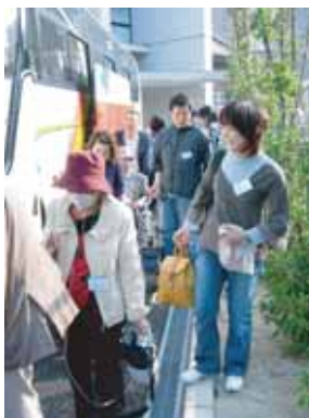
バスに乗り込んで出発!