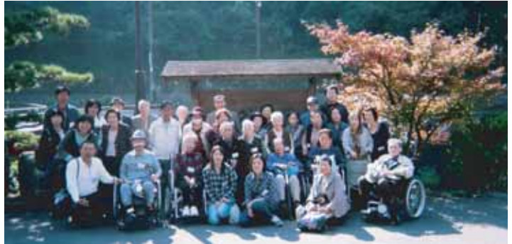
湯本温泉大谷山荘の旅に参加されたみなさん